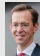
Prof. Dr. Karl Riesenhuber