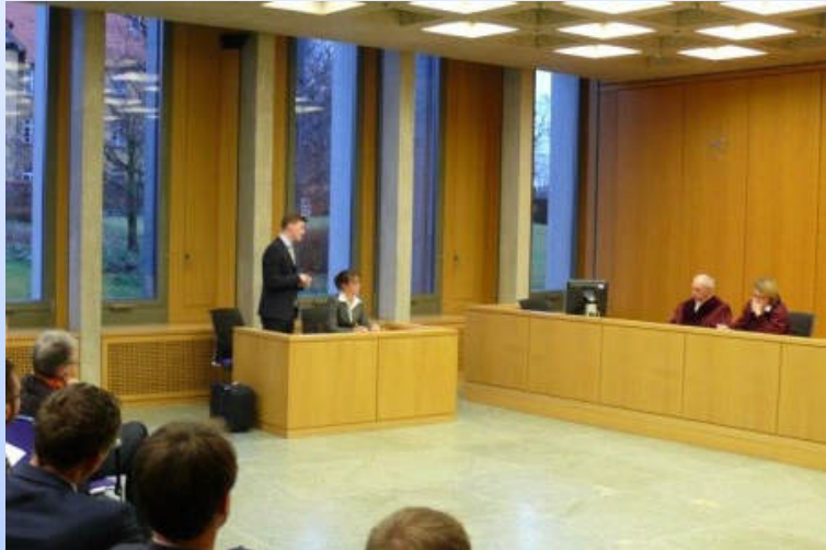
Moot Court des Bundesarbeitsgerichts